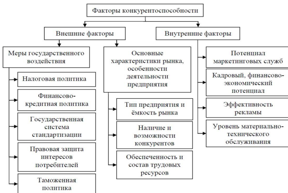
Рис. 2 Факторы конкурентоспособности предприятия

По данному рис. 2 можем увидеть, что деятельность предприятия подвергается множественным факторам, каждая из которых характерна своими особенностями формирования и спецификой регулирования, как на макроуровне, так и внутри предприятия могут выделяться те или иные факторы. Они, в свою очередь, могут воздействовать не только в сторону повышения конкурентоспособности предприятия, но и в сторону понижения [7, с. 24].