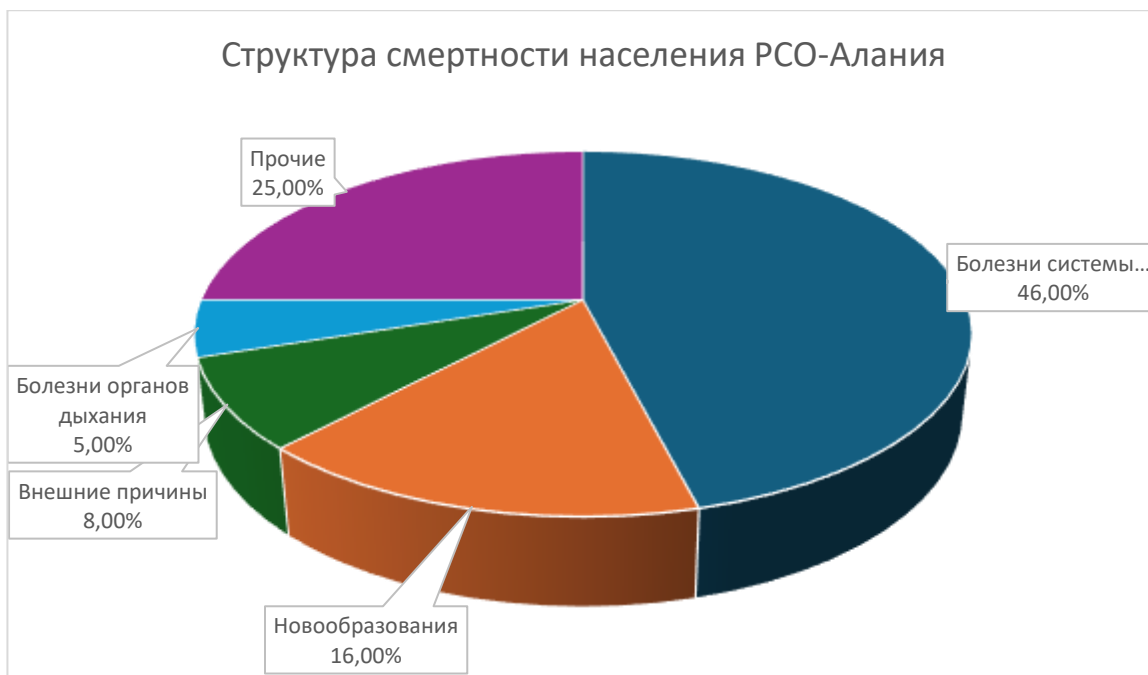
Рис. 1. Структура смертности населения РСО-Алания по основным классам причин, 2023 г. Болезни системы кровообращения — 46%, Новообразования- 16%, Внешние причины — 8%, Болезни органов дыхания — 5%, Прочие -25%.