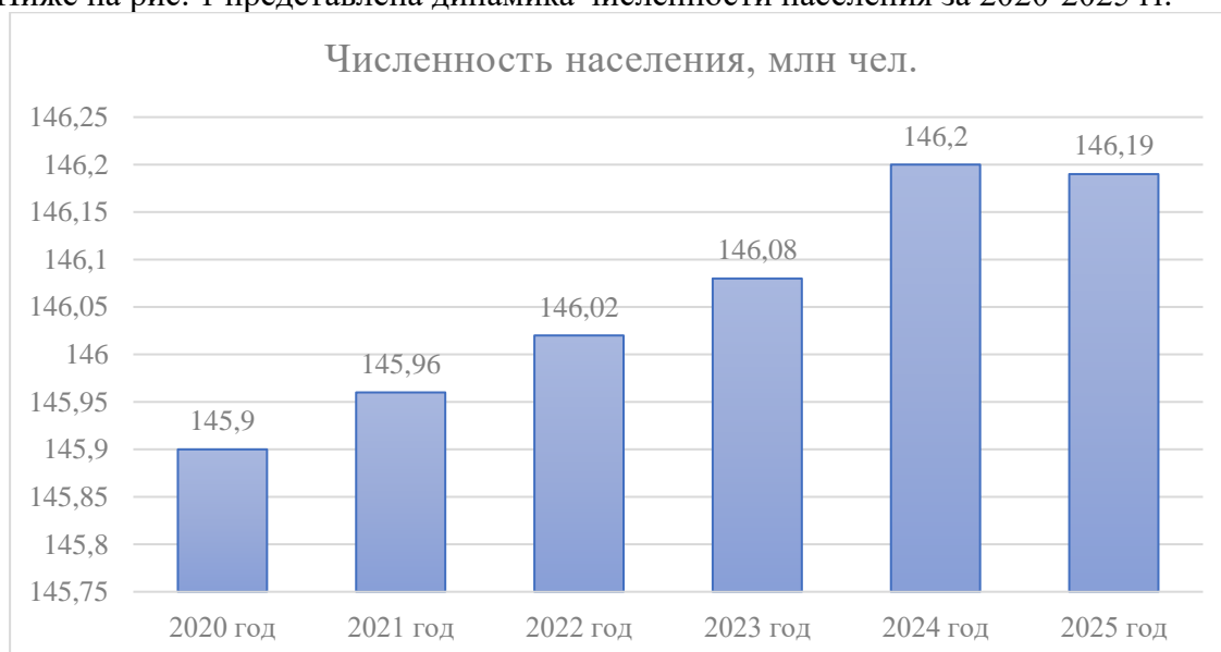
Рисунок 1. Динамика численности населения за 2020-2025 гг., млн чел.

Ниже на рис. 1 представлена динамика численности населения за 2020-2025 гг.