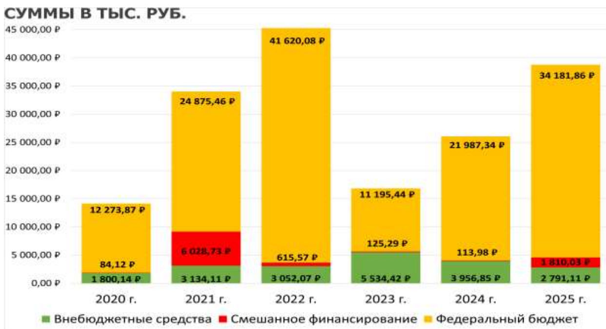
Рис. 2 Финансирование НИОКР по вопросам развития сельского хозяйства по всем заказчикам с 2020 по 2025 годы.

Импорт данных в реляционную СУБД обеспечил возможность многомерного анализа динамики финансирования в разрезе годов и ведомств. Выявлено, что пик количества стартовавших работ пришелся на 2022 год (1 831 ед.), тогда как пик финансирования сдвинут на 2025 год (38,8 млрд. руб.), что объясняется нарастающим бюджетным импульсом при относительном сокращении числа новых тем. Это подтверждает смещение акцента с количественного роста на концентрацию ресурсов (рис. 2).